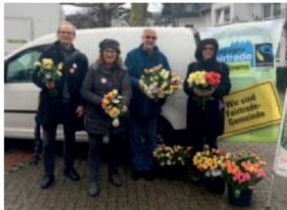
Die Steuerungsgruppe ‚Fair-Trade‘ verschenkte Fairtrade-Rosen im Ortskern von Engelskirchen

Mit den Prämiegeldern werden verschiedene Gemeinschaftsprojekte finanziert, beispielsweise im Bereich Bildung und Gesundheit.